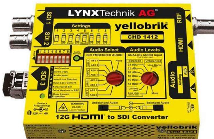
CHD 1412 yellobrik 模块