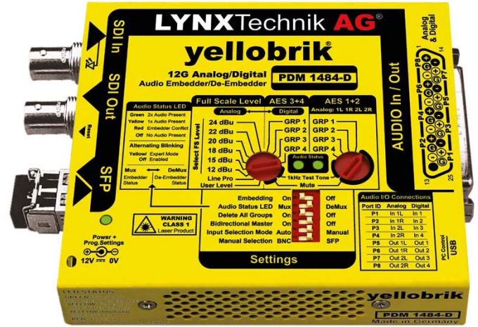
显示模块安装了光纤 SFP 选项

PDM 1484 D 是一款多功能 AES 音频加嵌器和解嵌器, 专为 12G-SDI 等多种 SDI 视频格式而设计。它支持使用 25 针 SubD 连接器的平衡 AES / 模拟音频输入/输出。